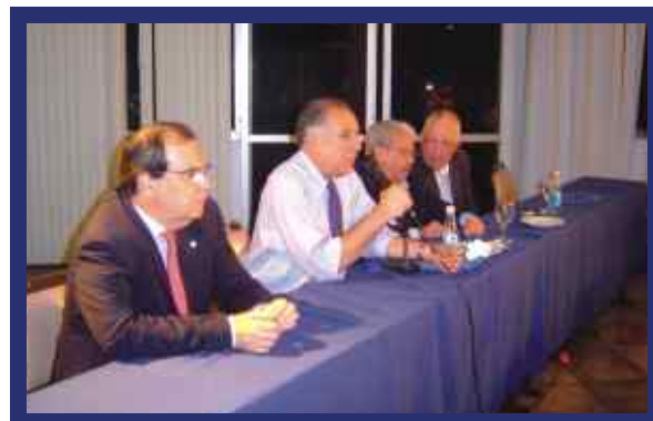
A Comissão Eleitoral anuncia o resultado