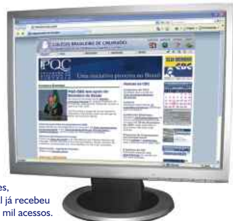
Em seis meses, o novo portal já recebeu cerca de 170 mil acessos.

para o boletim e a revista de Consensos, e preparou a identidade visual e cromática do logotipo do CBC em todos os materiais de papelaria.