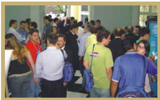
Realizado em BH, o Congresso teve a participação de mais de oito mil congressistas.