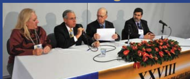
Presidente do CBC assina parceria com a Sociedade Brasileira de Cirurgia Bariátrica e Metabólica, no XXVIII Congresso Brasileiro de Cirurgia