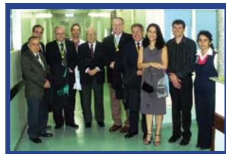
Grupo visitou o Hospital Dr. Júlio Sanderson