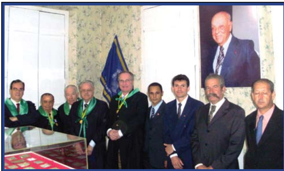
Membros do Colégio e da prefeitura de Aiuruoca na Sala CBC

As vitrines foram construídas em madeira com cobertura em acrílico. Na parte da frente foram afixadas placas em aço escovado com o logotipo do CBC. Em retribuição ao apoio do Colégio Brasileiro de Cirurgiões, a prefeitura de Aiuruoca cedeu uma sala exclusiva com o nome da entidade, onde colocou a bandeira e documentos relatando a participação de Julio Sanderson pelo CBC. Com 13 cômodos, o imóvel possui 329,95m 2 , edificado num terreno de 2.176m 2 .