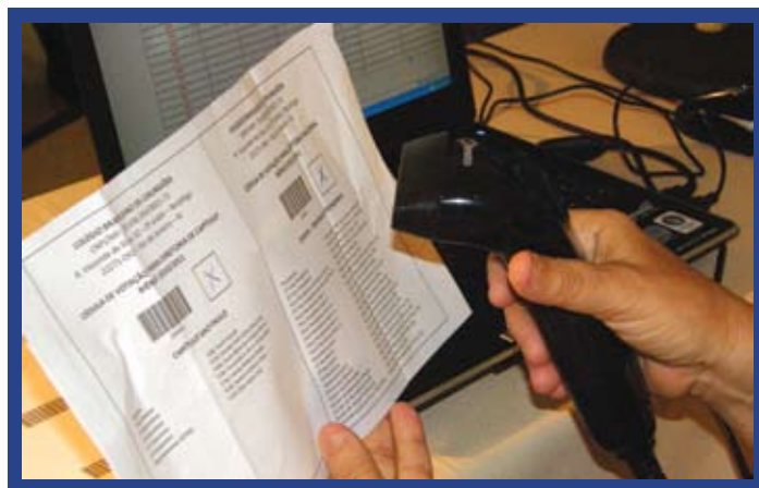
Na primeira eleição com apuração digital foram recebidos 950 votos válidos

Acesse o site do CBC e veja o resultado completo das eleições.