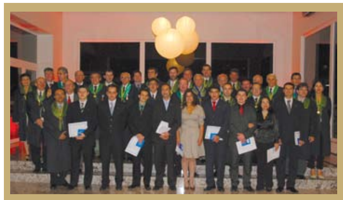
Novos membros tomaram posse no DF

O Capítulo do Distrito Federal realizou no dia 04 de junho de 2009, sessão solene presidida pelo presidente do Colégio Brasileiro de Cirurgiões, Edmundo Machado Ferraz, com a entrega de medalhas e certificados aos novos membros Eméritos, bem como a posse aos novos membros Adjuntos.