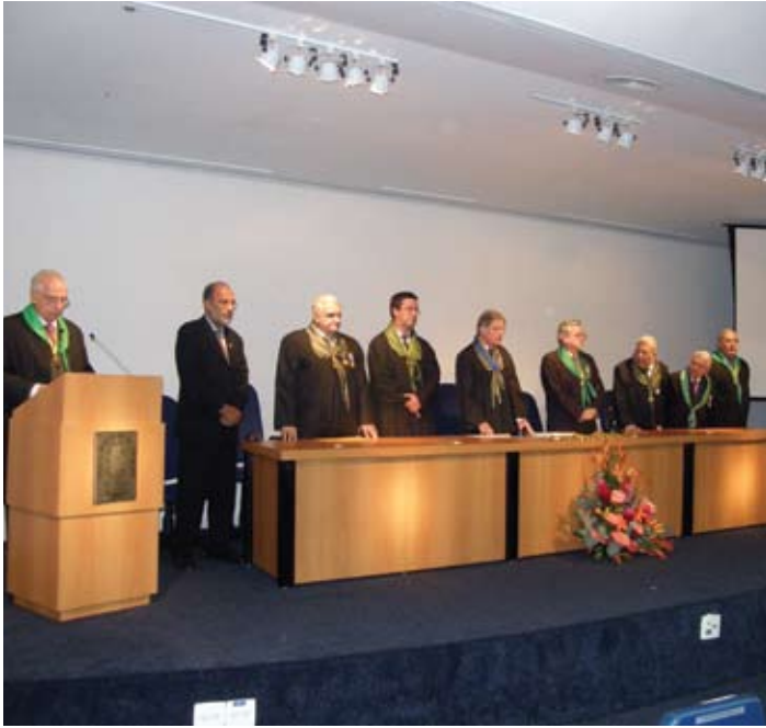
A Mesa que abriu a Sessão Solene das atividades de 2010.

A entrega do Prêmio CBC 2010 foi um dos destaques da programação