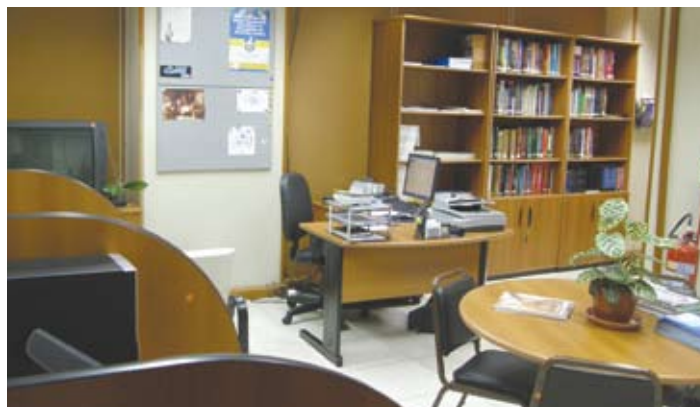
Panorâmica da sala.