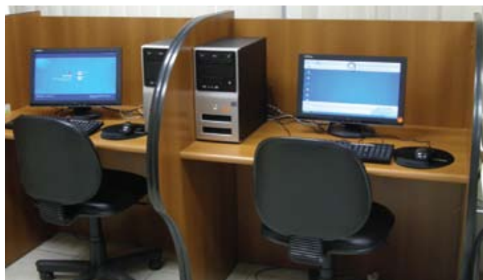
Detalhe do espaço exclusivo para pesquisa