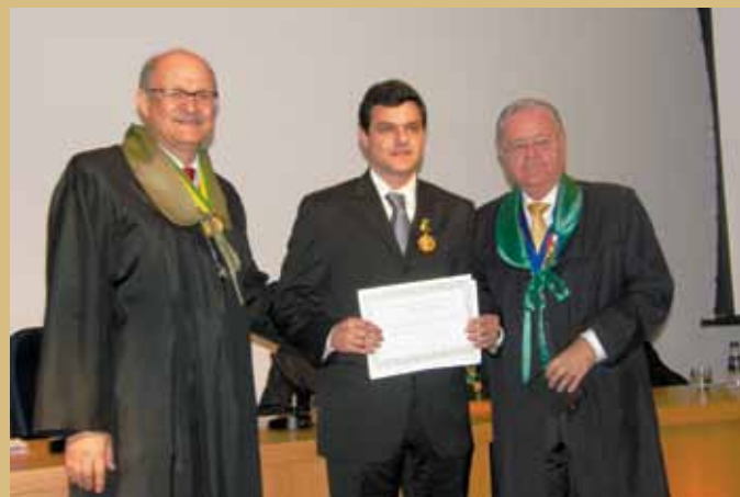
O 1º Vice-Presidente e o Presidente do CBC entregam o Certificado ao autor do trabalho vencedor.

Trabalho: "Resultados Funcionais do Auto-implante de Paratireóides em Loja Única no Tratamento do Hiperparatireoidismo Secundário". Revista Colégio Brasileiro de Cirurgiões – Volume 38(2): 085-089, março/abril de 2011.