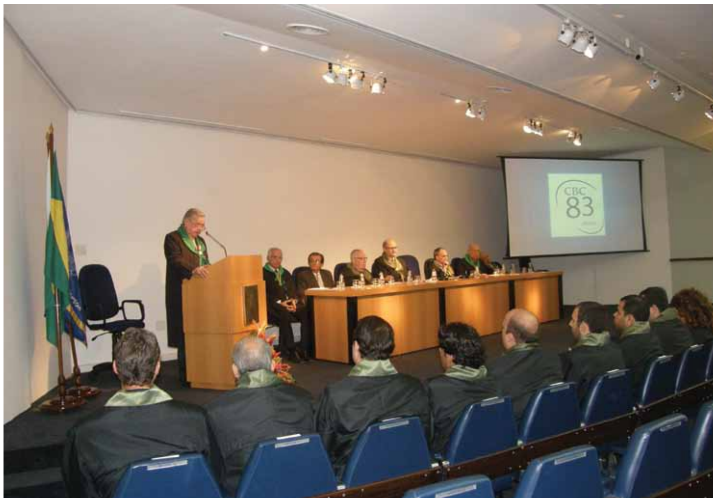
O Presidente do CBC lembrou as principais realizações do Diretório Nacional