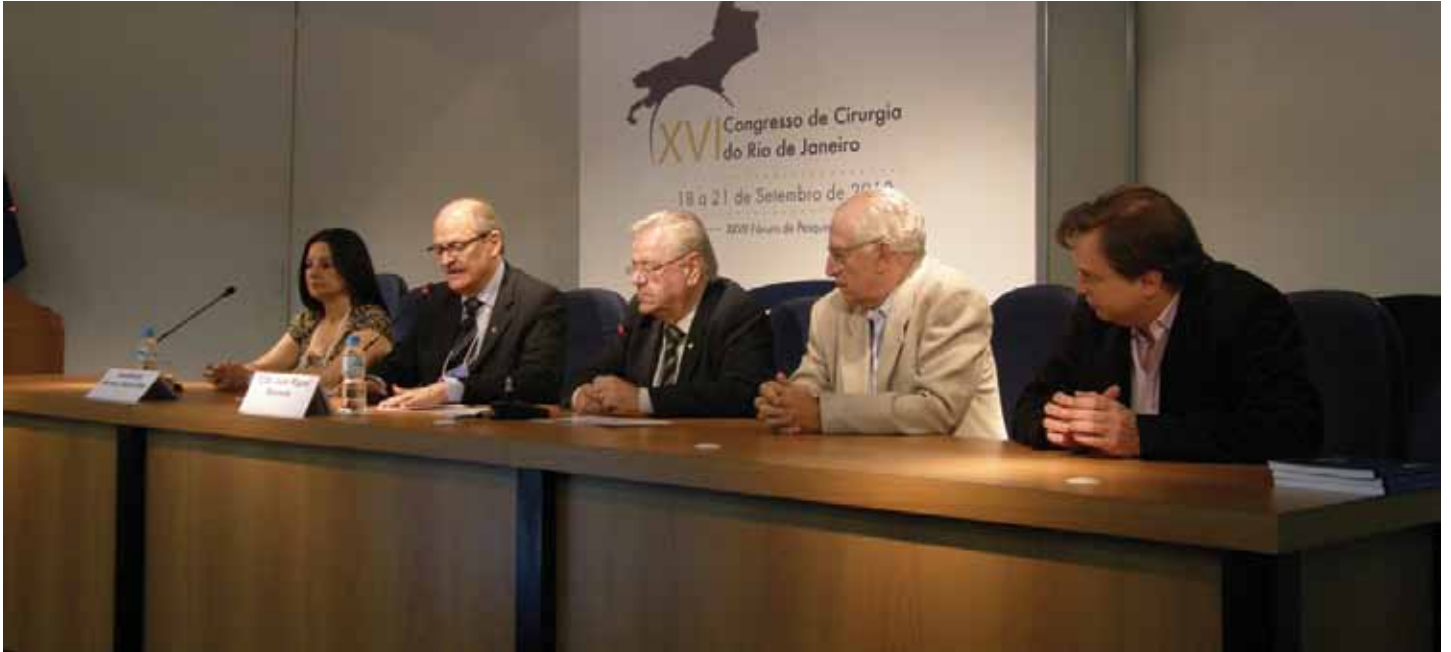
Cerimônia de encerramento