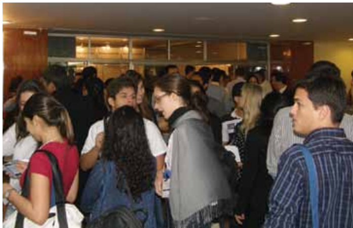
O evento foi um sucesso de público.