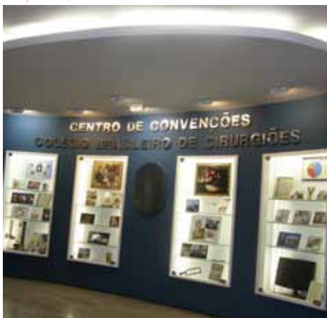
A vitrine principal da nova exposição histórica.