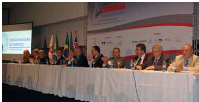
A Mesa Diretora