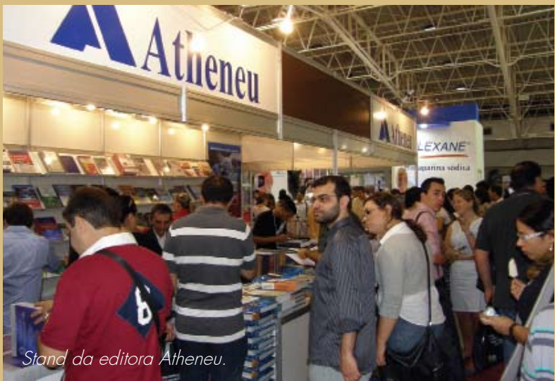
Stand da editora Atheneu.