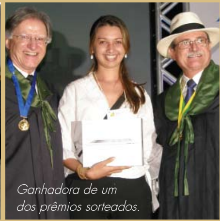
Ganhadora de um dos prêmios sorteados.