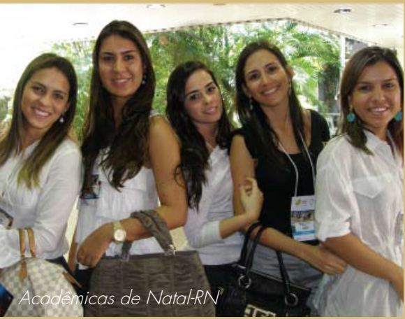
Acadêmicas de Natal-RN