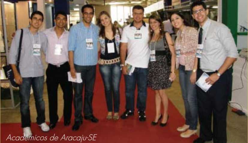
Acadêmicos de Aracaju-SE