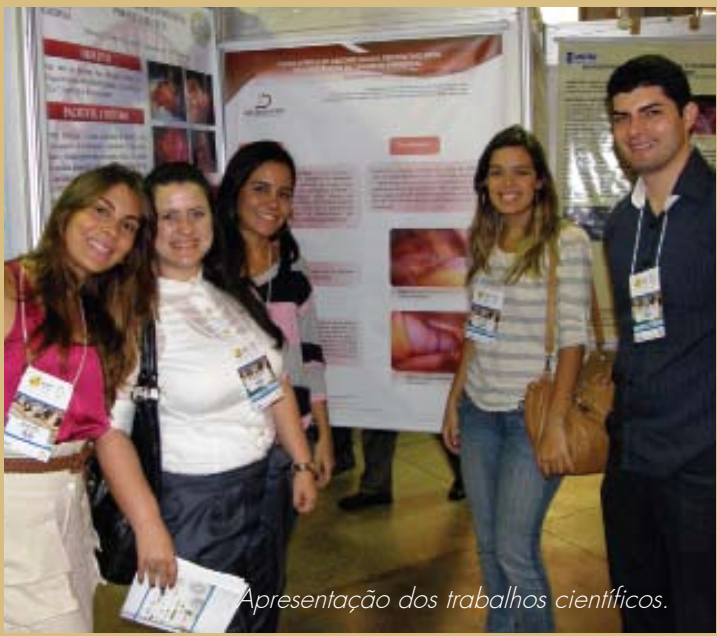
Apresentação dos trabalhos científicos.