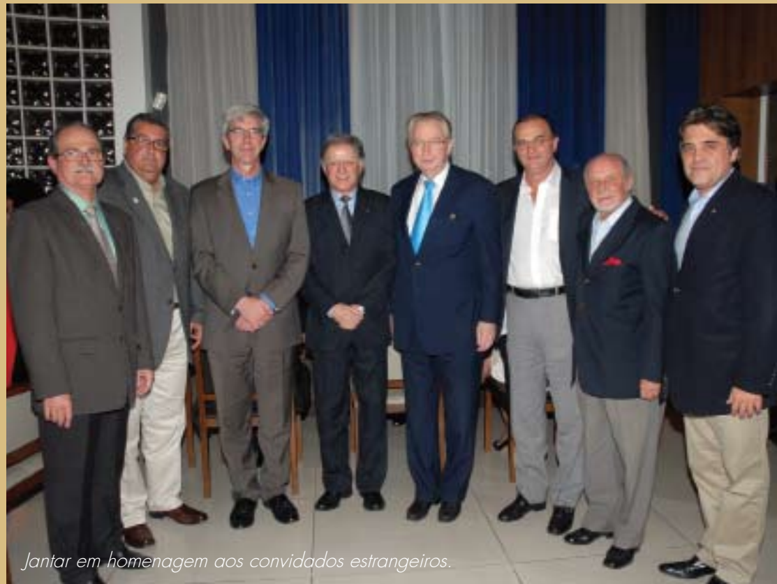
Jantar em homenagem aos convidados estrangeiros.