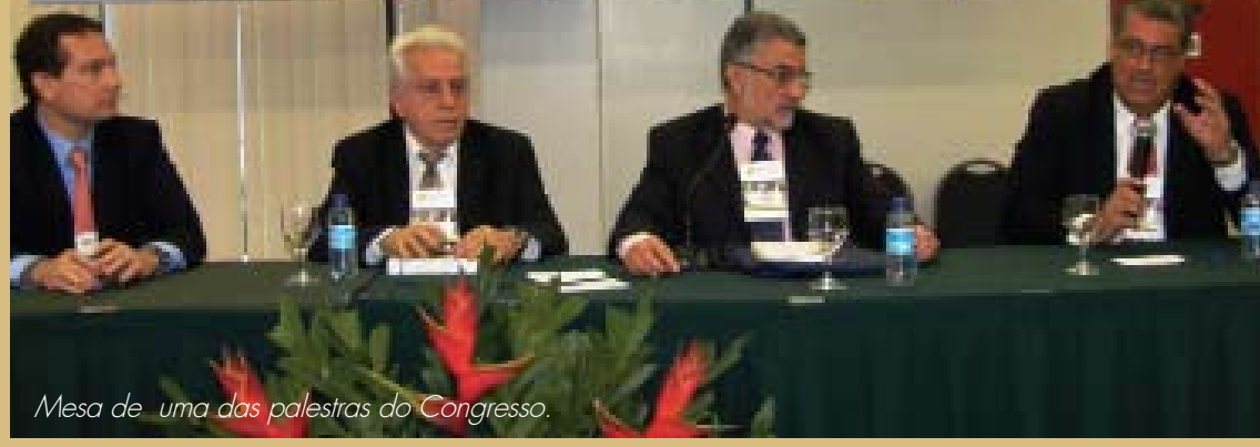
Mesa de uma das palestras do Congresso.