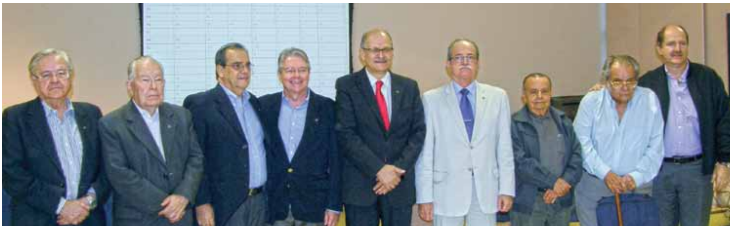
Os integrantes da chapa vencedora e os da Comissão Eleitoral.