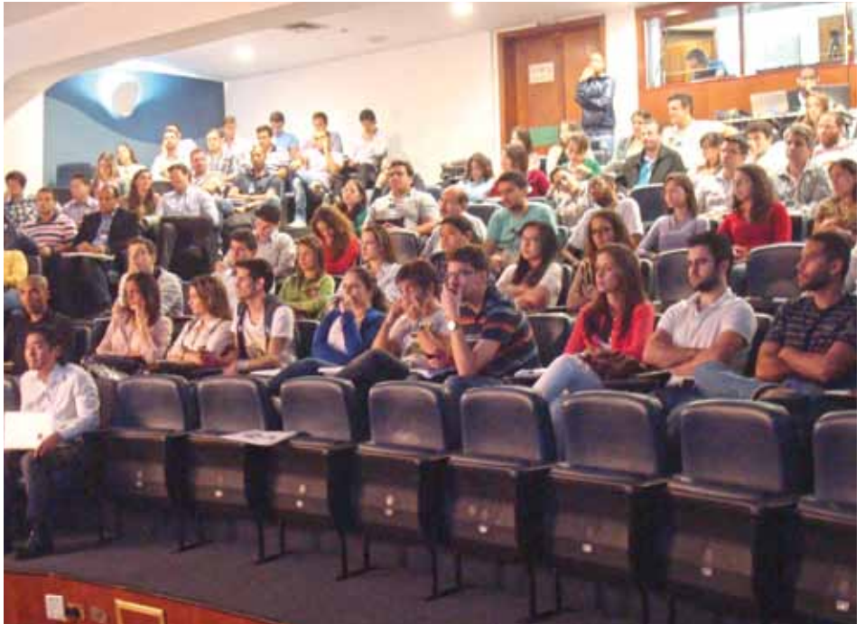
O Curso teve a participação de 235 alunos.

O Curso Continuo de Cirurgia Geral do CBCSP conclui sua oitava edição com 235 alunos e atinge pleno êxito quanto à proposta de oferecer subsídios teóricos para os que se iniciam na prática cirúrgica e também para os colegas interessados em atualizar seus conhecimentos e condutas. A programação teórica é ministrada ao longo de oito reuniões mensais aos sábados, baseia-se no programa do Concurso para obtenção