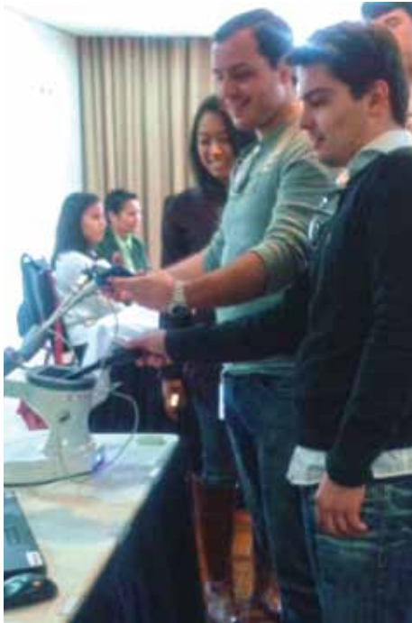
Testes nos simuladores.