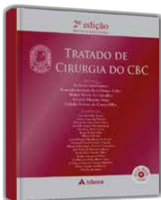
Tratado de Cirurgia do CBC 2ª edição Revista e Atualizada Roberto Saad, Roberto Vianna, Walter Moreira, Heládio Feitosa de Castro Filho e Accioly Maia Formato: 21 x 28 cm | Páginas: 1.612