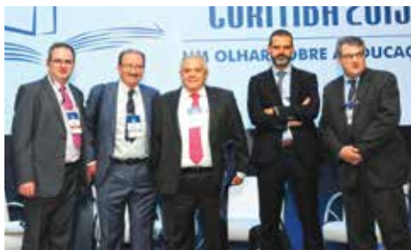
Integrantes da comissão organizadora entre 3 palestrantes internacionais

O Congresso Brasileiro de Cirurgia do CBC manteve a tradição de valorizar a participação dos convidados estrangeiros. Na 30ª edição, foram recebidos 32 palestrantes internacionais, a maioria da América do Sul.