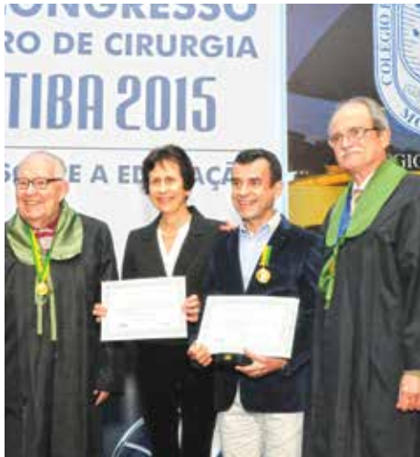
Vencedores do Prêmio Oscar Alves.