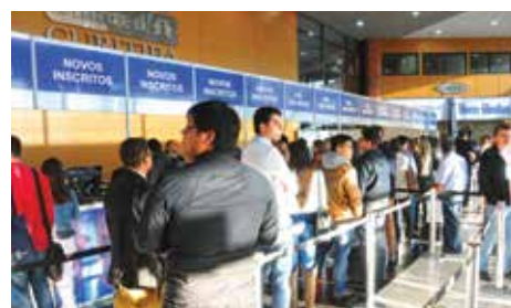
O Congresso teve mais de 4 mil inscritos.