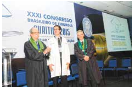
Procurador recebe o jaleco de especialista no combate à corrupção.

Além de assuntos ligados à medicina, foi realizada a Conferência de Abertura "Corrupção. Qual a solução", ministrada pelo Procurador da República e Coordenador da Lava-Jato, Deltan Dallagnol, na qual foi firmado o apoio dos cirurgiões ao Combate à Corrupção no Brasil. Muitos congressistas e palestrantes assinaram o documento proposto pelo Procurador em sua campanha junto ao Ministério Público Federal, o qual estava disponível,