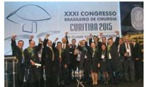
Membros da Comissão Organizadora comemoram o sucesso do evento.