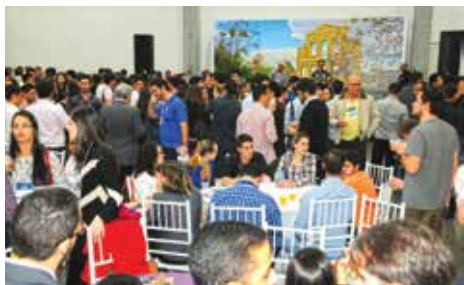
Todo final de dia aconteceu uma confraternização entre os congressistas.

sendo 1 auditório para capacidade de 700 pessoas, sala vip para palestrantes, área de alimentação, restaurante, além de uma ampla exposição comercial.