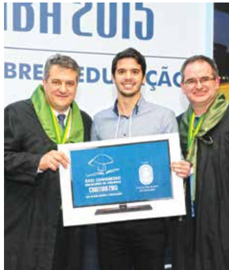
Ganhador de um dos prêmios.

Realizada no dia 5 de agosto, a cerimônia de encerramento teve uma participação expressiva dos congressistas através da premiação dos melhores trabalhos científicos e sorteios de inúmeros brindes. Em seu discurso, o presidente do CBC, Heládio Feitosa de Castro Filho lembrou que o sucesso do evento de Curitiba foi o resultado das experiências na realização dos eventos anteriores, principalmente nos promovidos fora do eixo Rio-São Paulo. " O CBC No final, convidou todos os congressistas para participarem do XXXII Congresso Brasileiro de Cirurgia, em 2017, na cidade de São Paulo.