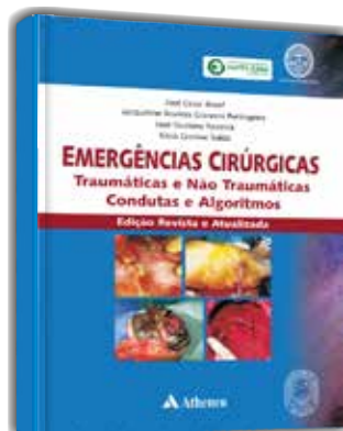
Emergências Cirúrgicas Traumáticas e Não Traumáticas - Condutas e Algoritmos - Edição Revista e Atualizada José Cesar Assef et al. Formato: 17 x 24,5 cm | Páginas: 384