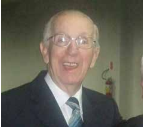
ECBC Ernesto Damerou (1932 – 2015)

Falecido no dia 19 de agosto de 2015, aos 83 anos, o ECBC Ernesto Francisco Damerou foi um verdadeiro exemplo para várias gerações de médicos formados em solo catarinense. Cirurgião de expressão maior da medicina humanizada praticada no estado de Santa Catarina, Ernesto Damerou tinha 57 anos de exercício da medicina.