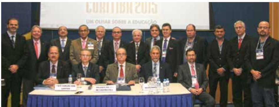
Integrantes do Diretório Nacional 2014/2015.

Coordenada pelo Presidente do CBC no dia 3 de agosto, a reunião foi aberta com a exibição do vídeo da cobertura da TV Globo da solenidade de abertura. Uma das pautas principais foi o sucesso do Congresso em Curitiba.