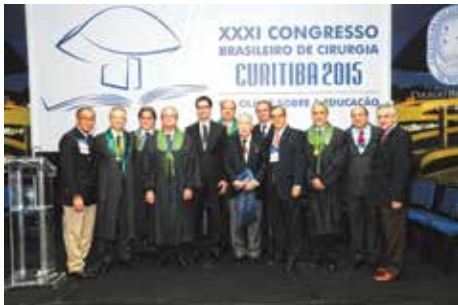
Membros do Diretório Nacional e Conselho Superior ao lado do Procurador da República.

Além de assuntos ligados à medicina, foi realizada a Conferência de Abertura "Corrupção. Qual a solução", ministrada pelo Procurador da República e Coordenador da Lava-Jato, Deltan Dallagnol, na qual foi firmado o apoio dos cirurgiões ao Combate à Corrupção no Brasil. Muitos congressistas e palestrantes assinaram o documento proposto pelo Procurador em sua campanha junto ao Ministério Público Federal, o qual estava disponível,