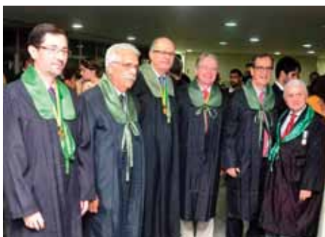
Os integrantes da Mesa de abertura do evento durante o coquetel de confraternização