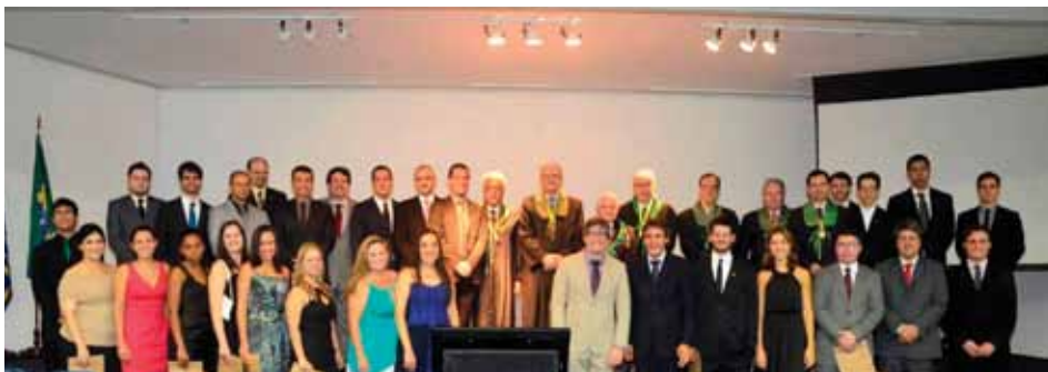
O grupo de novos Membros com os integrantes da mesa.