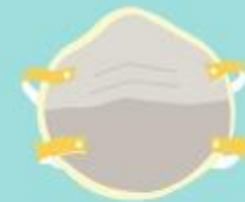
Máscara N95/PFF2 ou equivalente